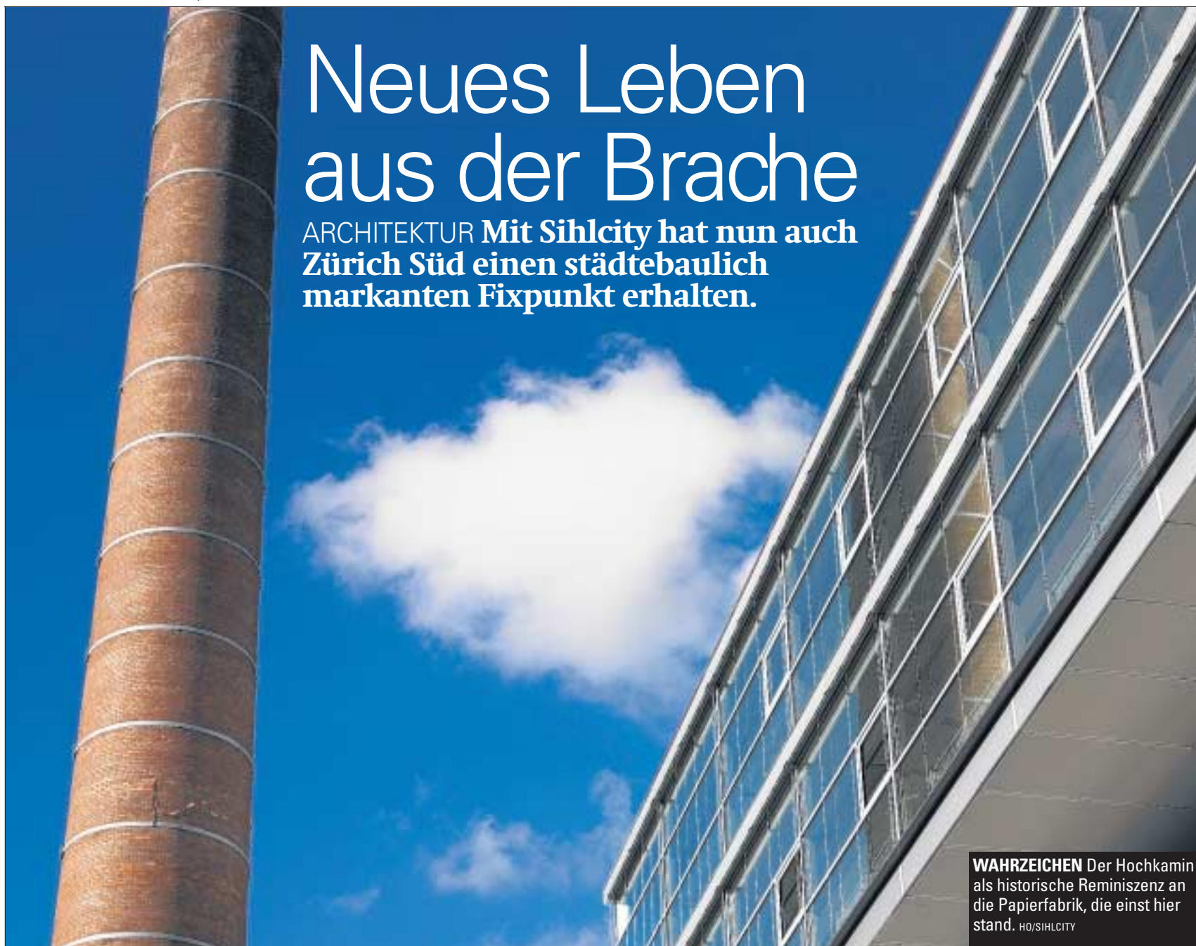
WAHRZEICHEN Der Hochkamin als historische Reminiszenz an die Papierfabrik, die einst hier stand.

ARCHITEKTUR Mit Sihlcity hat nun auch Zürich Süd einen städtebaulich markanten Fixpunkt erhalten.